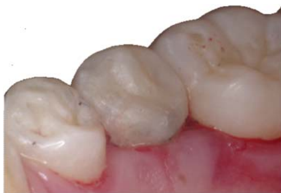
Figura 20. Premolar fracturado, mostrando la reconstrucción directa terminada con resina y dos pines.