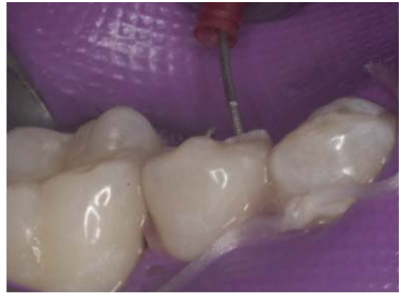
Figura 17. Introduciendo los pines en los orificios.

Determinamos que podríamos lograr mejor retención mecánica si los doblamos hacia el centro del premolar,