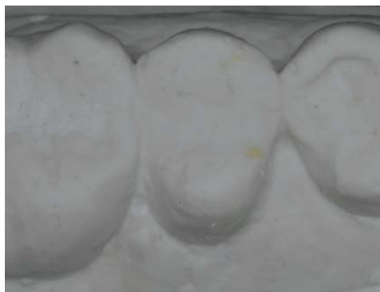
Figura 8. Premolar reconstruido. Sobre el modelo se fabrica el acetato .020 mm.