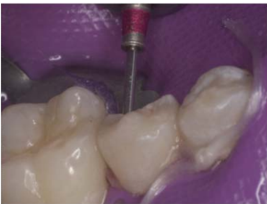
Figura 16. Elaboración de los orificios con la fresa maestra.