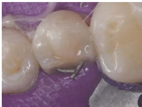
Figura 19. Dobleces de los pines y elaboración del procedimiento adhesivo.

Finalmente le fue colocada la resina de nanorrelleno en capas, hasta dejar lista la morfología y anatomía de la cúspide lingual, lo mejor posible. Se retiró el dique de hule y se valoró la oclusión para retirar algún contacto prematuro, terminar la anatomía y pulir la restauración, tal y como se pulen las resinas de nanorrelleno. El paciente presentó un poco de sangrado que se provocó con la fresas de terminado y el aislamiento del campo operatorio. Finalmente se logró una restauración funcional, de aspecto agradable y sobre todo muy conservadora (Figura 20).