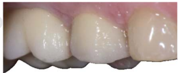
Figura 14. Vista vestibular de la corona vestibular.