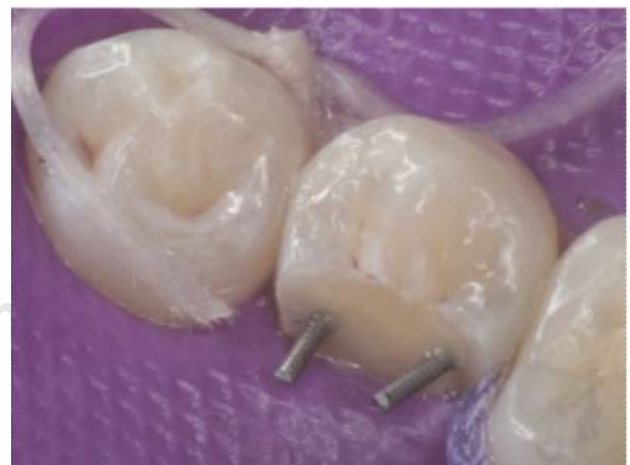
Figura 18. Se observa los pines en su lugar y se valora si hay que doblarlos.