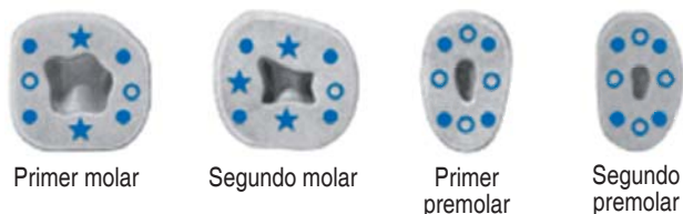
Figura 4. Recomendaciones para elegir los sitios de colocación de pines, según el Dr. Peter Riethe.