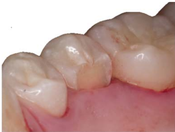
Figura 15. Premolar inferior con la fractura de la cúspide lingual.

Siendo conservadores, no se pensó en elaborar una corona. Por el tipo de fractura que se presentó, no fue posible restaurarla con una restauración directa de metal o amalgama; tampoco fue posible colocar una restauración indirecta de algún compuesto resinoso o de porcelana, por lo que se pensó restaurarla con resina de nanorrelleno, pero colocando dos pines para retención mecánica, adicional a la adhesión. Este procedimiento es conservador y se evitara con ello una restauración invasiva.