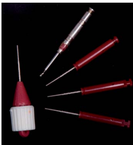
Figura 6. Fresa para realizar el orificio y los pines para insertarse en el orificio, para contrángulo de baja velocidad y el pin insertado en el aditamento, para colocarlo de forma manual.

Después de llevar a cabo todo el protocolo de adhesión, se carga de resina de macrorrelleno el acetato que se elaboró en el modelo de yeso obtenido previamente, y que tiene un grosor de .020 mm, llevándose a la prepara-