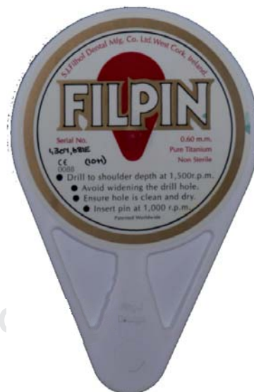
Figura 5. Sistema Filpin, de la compañía Filhol, pines flexibles de titanio puro.